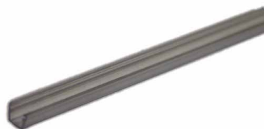
PP10 Perfil Plástico p/ perfil PA10 (4mts)