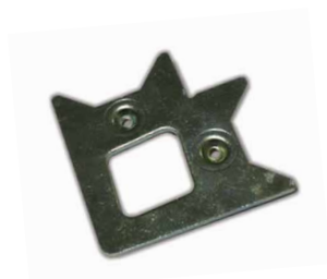
E10 Esquadro p/ perfil PA10