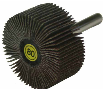
Óxido de alumínio