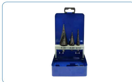
3pc TiAl Conjunto Brocas Escalonadas (Caixa metálica)