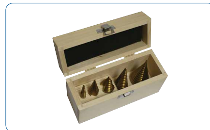
5pc TiAl Conjunto Brocas Escalonadas (Caixa de madeira)