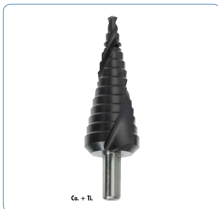
Co. + Ti.